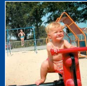
De Italiaanse Meren: u vindt er verkoeling tijdens zomerse dagen